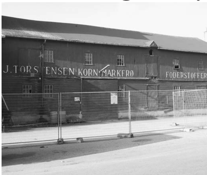
Bevaringsværdig eller ej?

·I hvor høj grad skal stationsbypræget bevares?